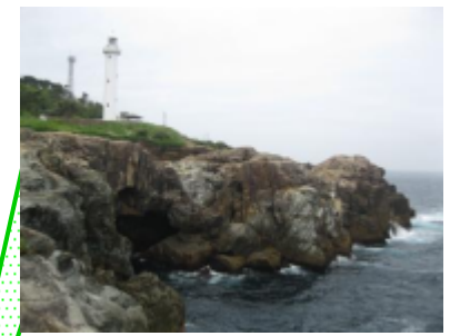
遊歩道入口から灯台までは 徒歩で60~70分