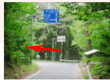
姉吉バス停分岐点付近左折 (宮古駅から約55分)