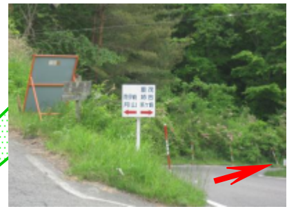
月山分岐点 姉吉方面へ (宮古駅から約30分)