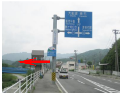
川帳場バス停付近左折 (宮古駅から約15分)