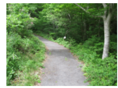
宮古駅から遊歩道まで約65分