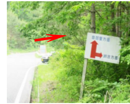
音部方面との分岐点 姉吉方面に右折して下さい